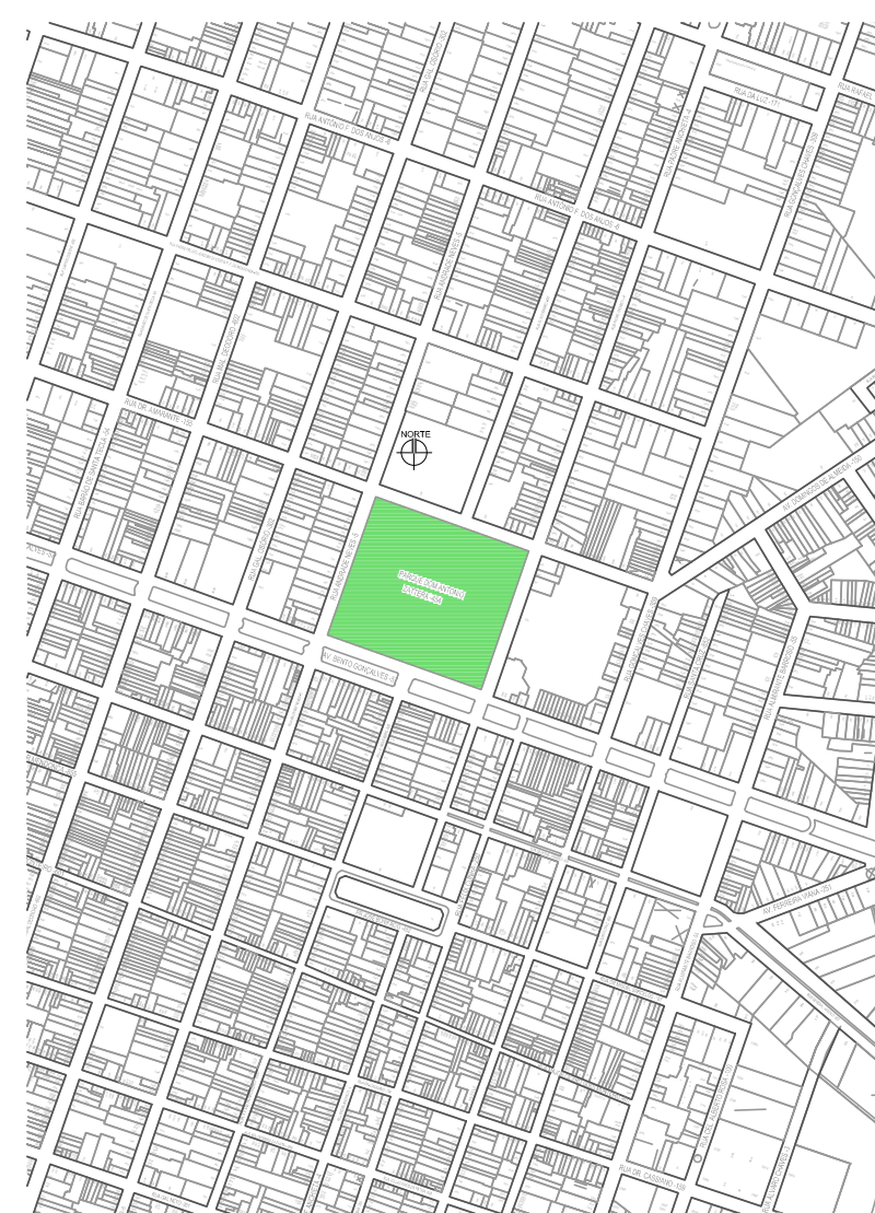
PLANTA SITUAÇÃO ESC. 1:10000