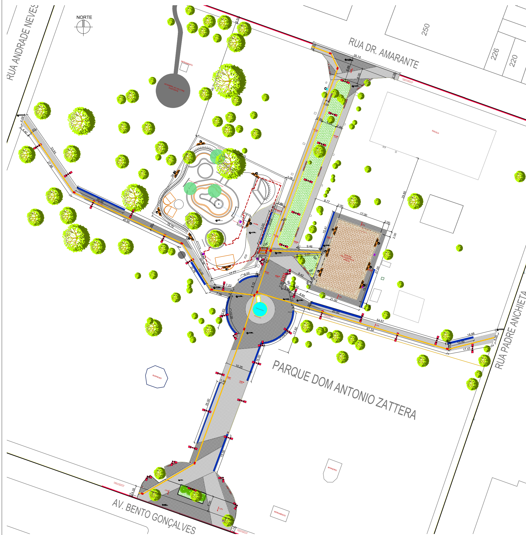
PLANTA BAIXA ESC. 1:750