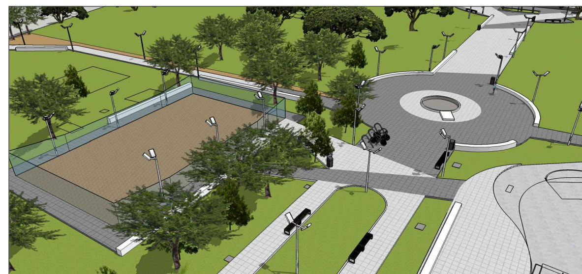
ILUSTRAÇÃO PRAÇA ENTORNO PAVIMENTADO SEM ESCALA